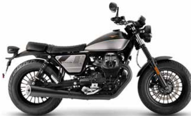
nero twin tone

Leasing /Monat ab Leasing/mois à partir de *** CHF 139.-